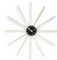
Star Clock, chrome/laiton, Ø 610