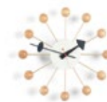
Ball Clock, hêtre, Ø 330