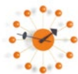
Ball Clock, orange, Ø 330