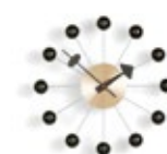
Ball Clock, noir/laiton, Ø 330