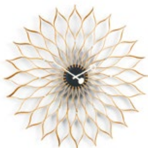
Sunflower Clock, bouleau, Ø 750