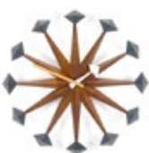
Polygon Clock, noyer, Ø 430