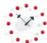
Ball Clock, rouge, Ø 330