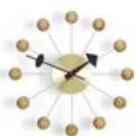
Ball Clock, cerisier, Ø 330