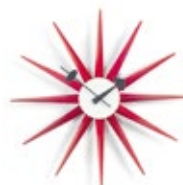
Sunburst Clock, rouge, Ø 470