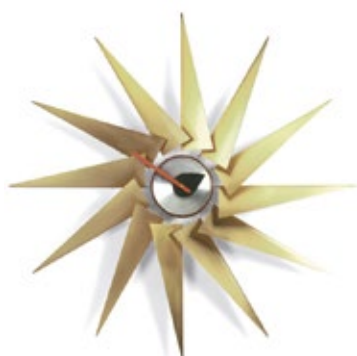
Turbine Clock, laiton/aluminium, Ø 765