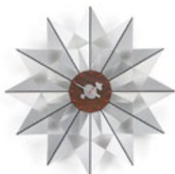
Flock of Butterflies, aluminium, Ø 610