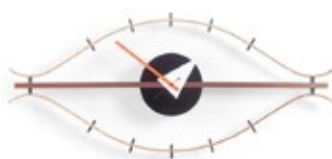
Eye Clock, laiton/noix, H 340 x L 760