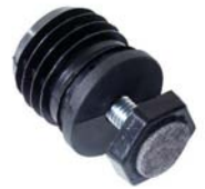
Bodenschoner mit Niveaueausgleich