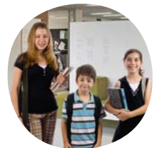
Gestellgrößen für alle Altersklassen