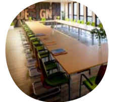
Klassische Rechteckform, vielfach bewährt