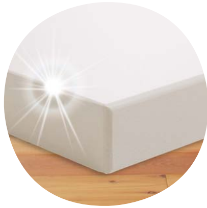
Robuste, 25 mm starke Tischplatte mit Kunststoffkante