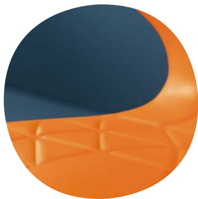
Sitzschale mit integrierten Lüftungskanälen ohne Löcher gegen Schimmel im Innenraum