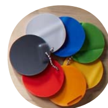
Verfügbar in vielen freundlichen Farben