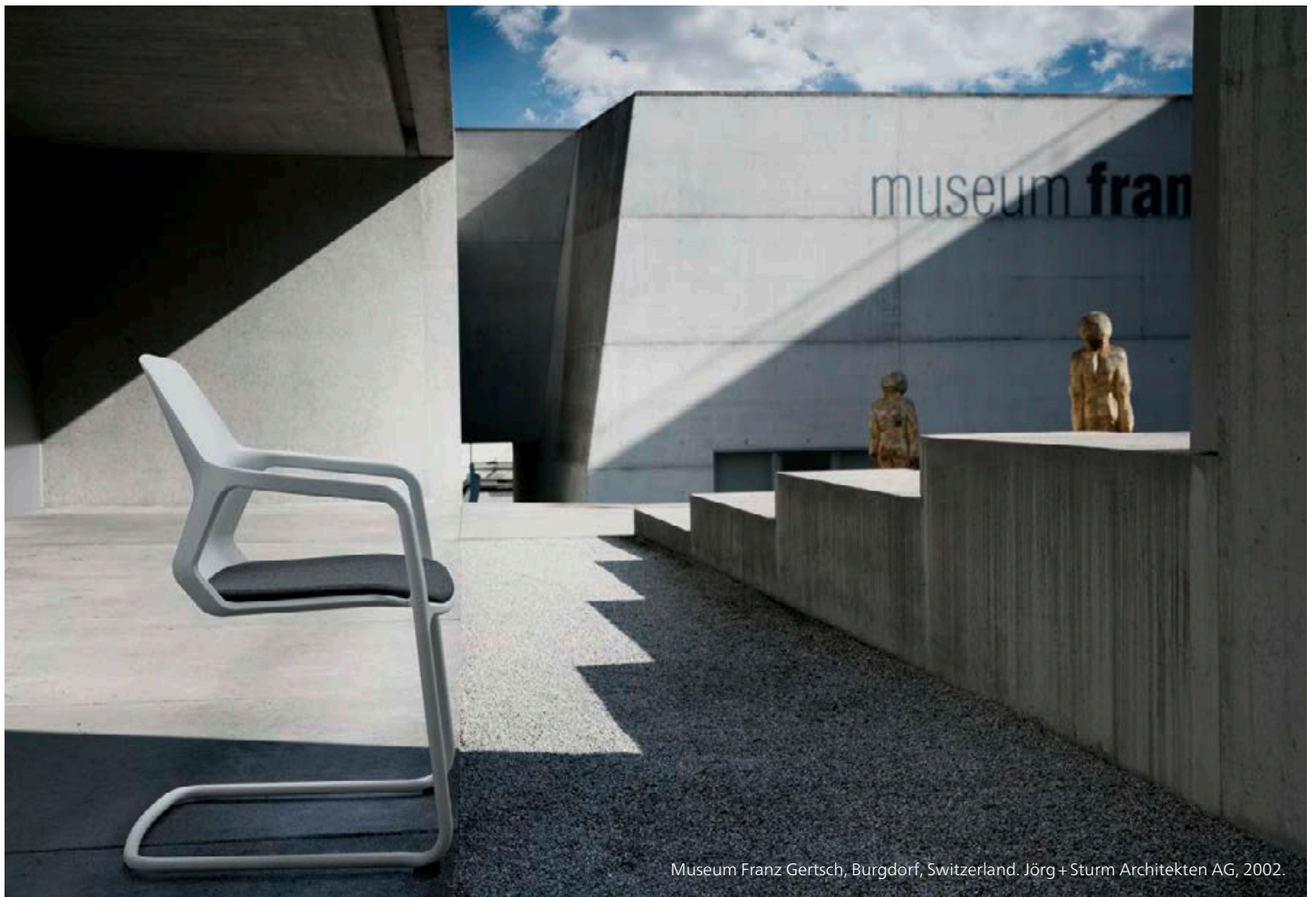
Museum Franz Gertsch, Burgdorf, Switzerland. Jörg + Sturm Architekten AG, 2002.