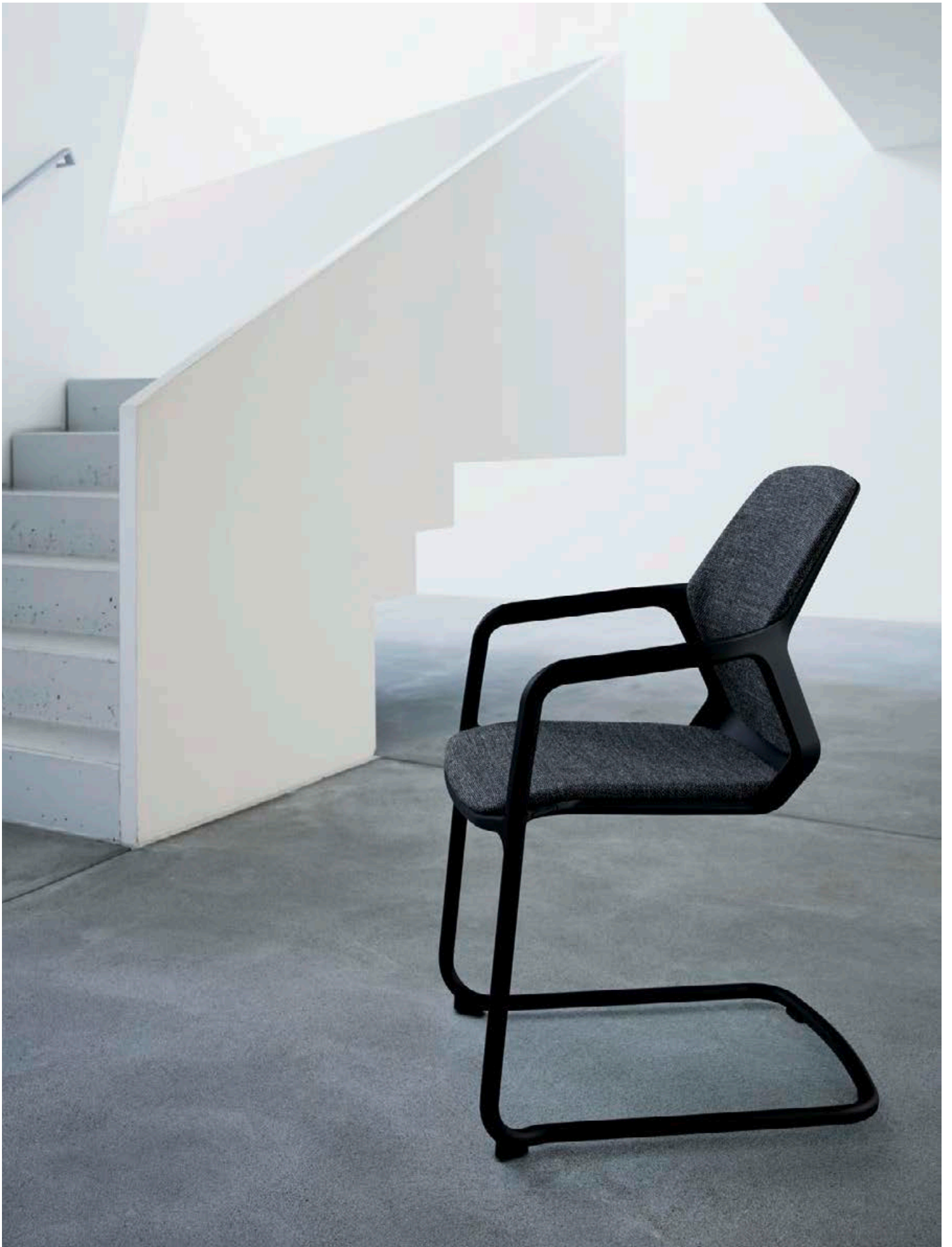
Musée Franz Gertsch, Burgdorf, Suisse. Jörg+Sturm Architekten AG, 2002. Le siège Metrik : des formes affirmées qui épousent les vôtres.