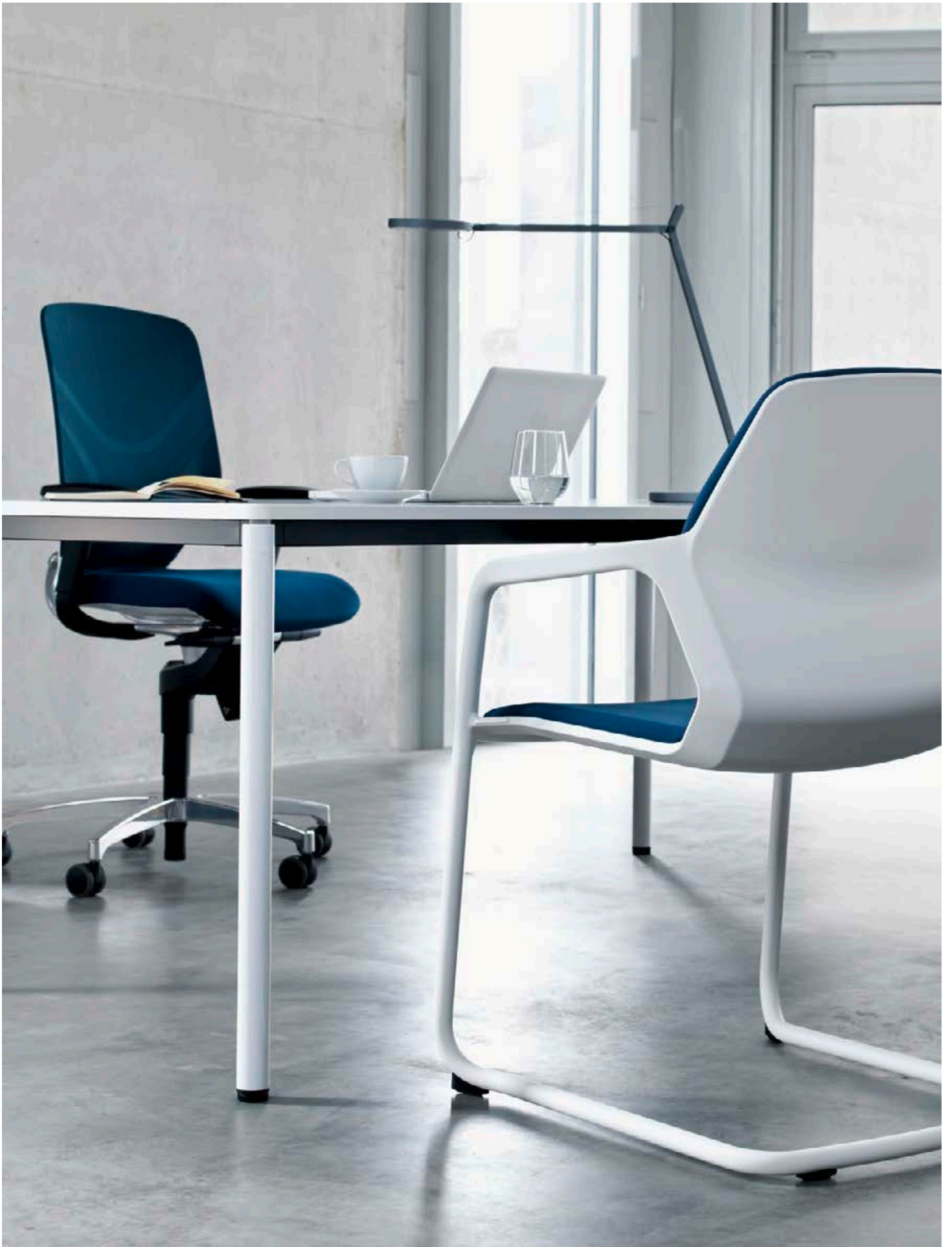
Metrik fait partout bonne figure – depuis les restaurants d'entreprise jusqu'aux espaces formation.