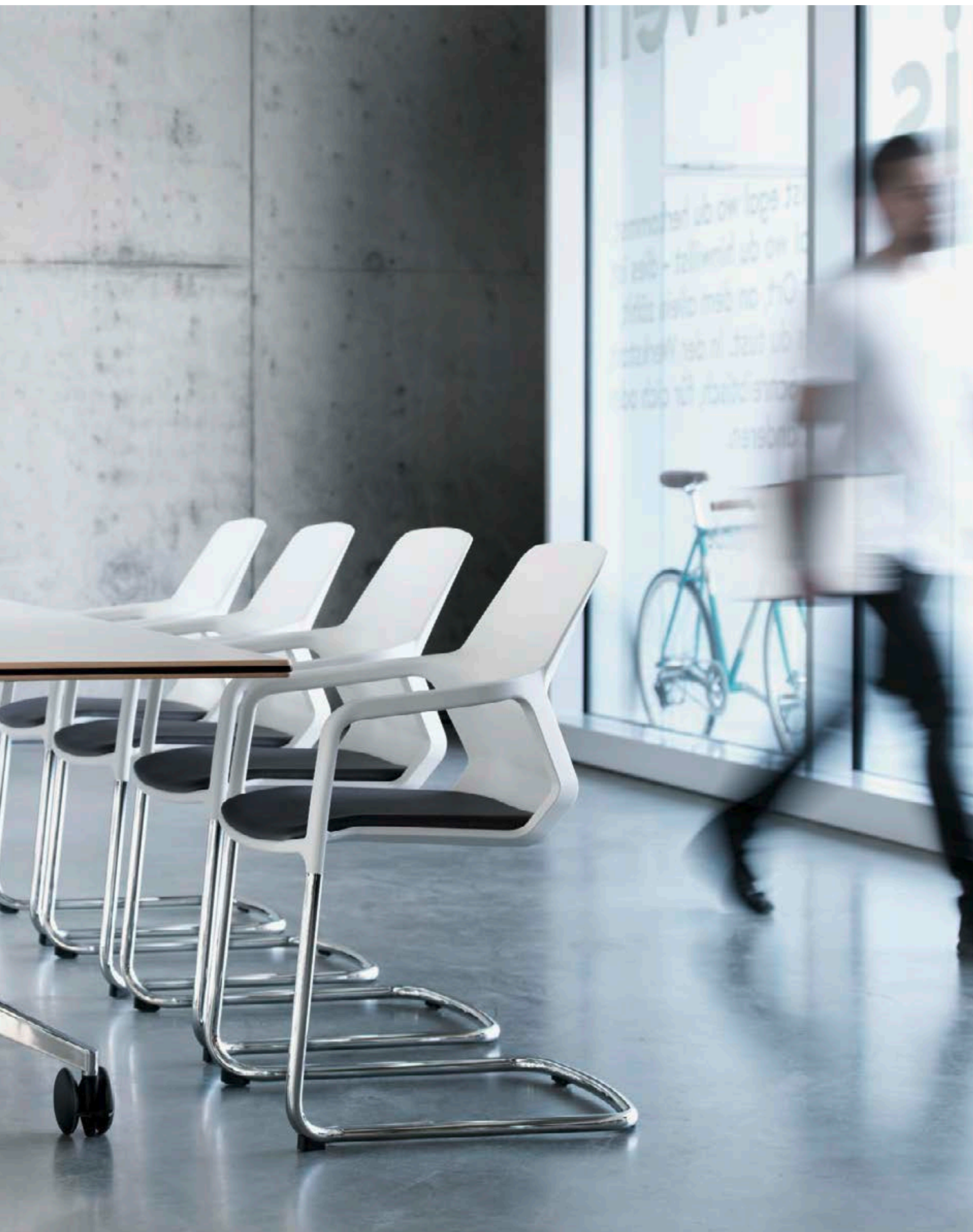
Résistance des matières et confort prédestinent Metrik au co-working et aux salles de réunion multifonctions.