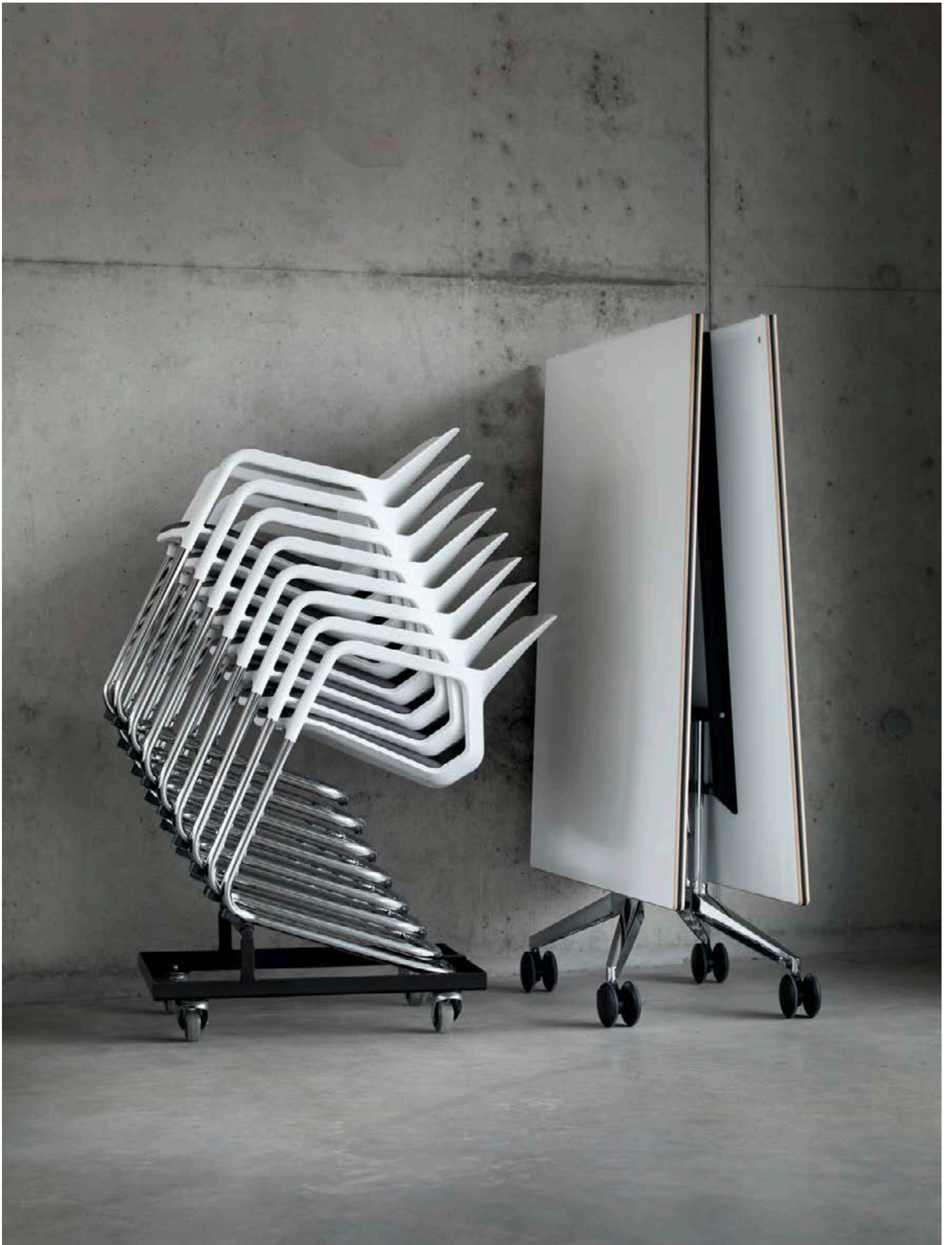
Metrik s'harmonise avec des sièges différents et diverses gammes de tables sans rien perdre de sa personnalité.