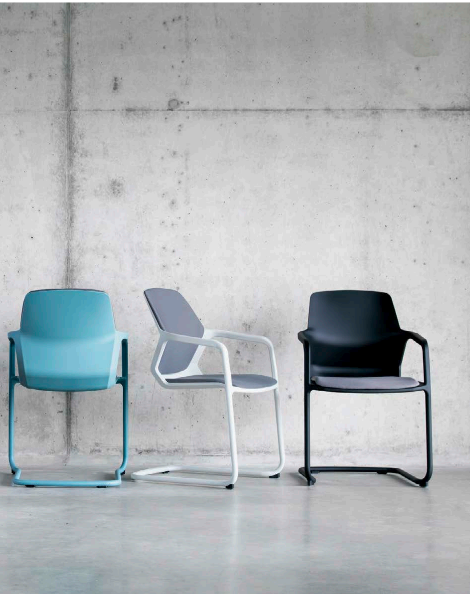
Lignes sculpturales, mais sans ostentation, et couleurs soutenues : la recette d'un impact visuel fort.